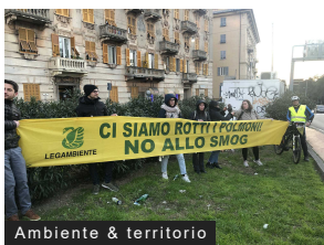
Ambiente & territorio

Efficientamento energetico: entro il 14 febbraio le candidature per inserimento in rete Ecn