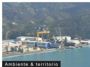
Ambiente & territorio

Gronda: incontro tecnico tra Aspi, Arpal e Asl 3 su sicurezza e criticità ambientali