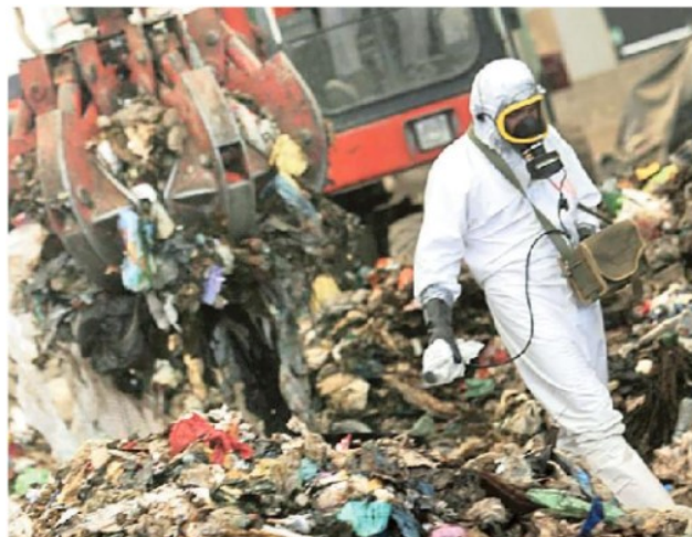
Nuovo accordo per contrastare i crimini legati al trasporto dei rifiuti

ARTICOLO NON CEDIBILE AD ALTRI AD USO ESCLUSIVO DEL CLIENTE CHE LO RICEVE - 9241