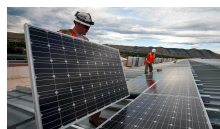
La Camera per le imprese

Fincantieri: tavolo tecnico per valutare il progetto di ampliamento di Riva Trigoso