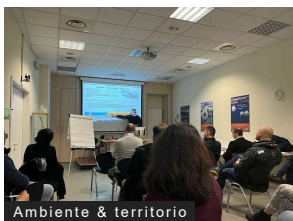
Ambiente & territorio

Gronda: incontro tecnico tra Aspi, Arpal e Asl 3 su sicurezza e criticità ambientali